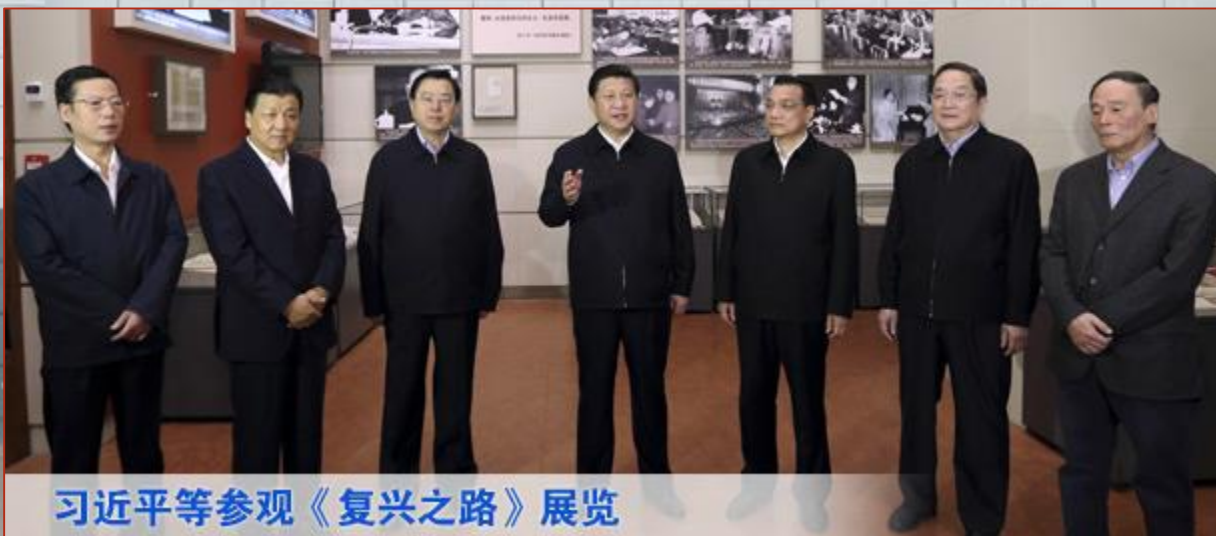
习近平等参观《复兴之路》展览

2012年11月29日，从战略高度论述了如何把全面建设小康社会的蓝图变为现实，并把全面建设小康社会作为实现中华民族伟大复兴中国梦的关键一步。