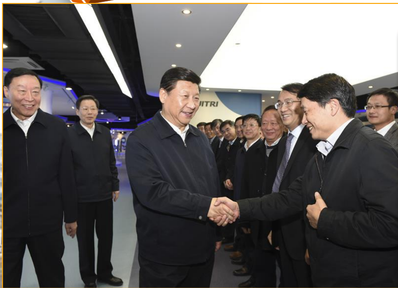
2014年12月13日，习近平调研江苏省产业技术研究院。